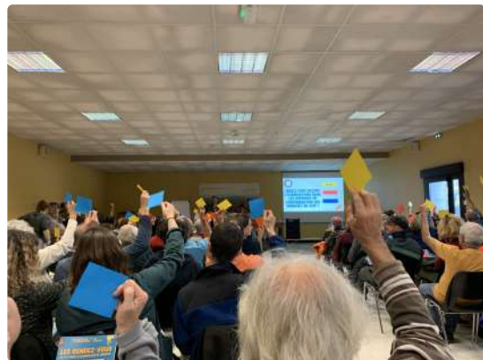
La soirée lancée avec un quiz, suivi de présentation, de témoignages et de temps d'échanges

Une série de rendez-vous est proposée pour donner suite à ce premier échange convivial et ainsi construire le collectif d'habitantes autour de la caisse d'alimentation de Lézignan. A commencer par les rendez-vous de novembre :