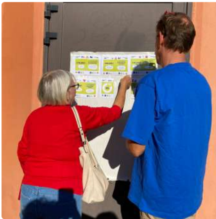
L'atelier organisé autour de l'étude "L'injuste prix de notre alimentation"

Une animation autour de l'étude " l'injuste prix de notre alimentation " a ouvert les festivités. Proposée par le Secours Catholique, les CIVAM et Solidarité Paysans, l'atelier a initié les discussions autour des constats et des enjeux liés à l'alimentation. La soirée s'est ensuite lancée avec présentations, quiz, témoignages et échanges. Elle s'est clôturée par la fameuse Grande Tablee, au repas gourmand, aux produits locaux et de qualité cuisiné par une équipe de bénévoles l'après-midi. Plus de 90 personnes étaient présentes durant la soirée, reflet d'un intérêt pour cette belle initiative !